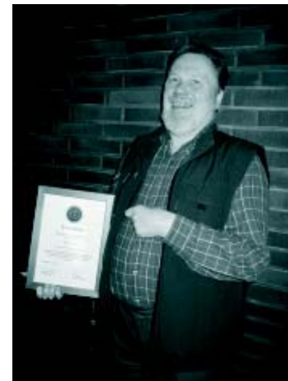
Onnellinen mies

Lapsuuteni ja nuoruuteni kesät, myös lähes jokaisen joulu-, hiihto- ja pääsiäsloman sain viettää Keski-Suomessa, Hietaman kylän läpi virtaavan koskireitin varrella. Perheemme kesämökki Norela sijaitsi aivan Hietamankosken alajuoksulla. Eipä ollut mikään ihme, että lähes päivittäin olin koskien äärellä, kesäisin kalalla ja talvisin tutkimassa koskien rakennetta