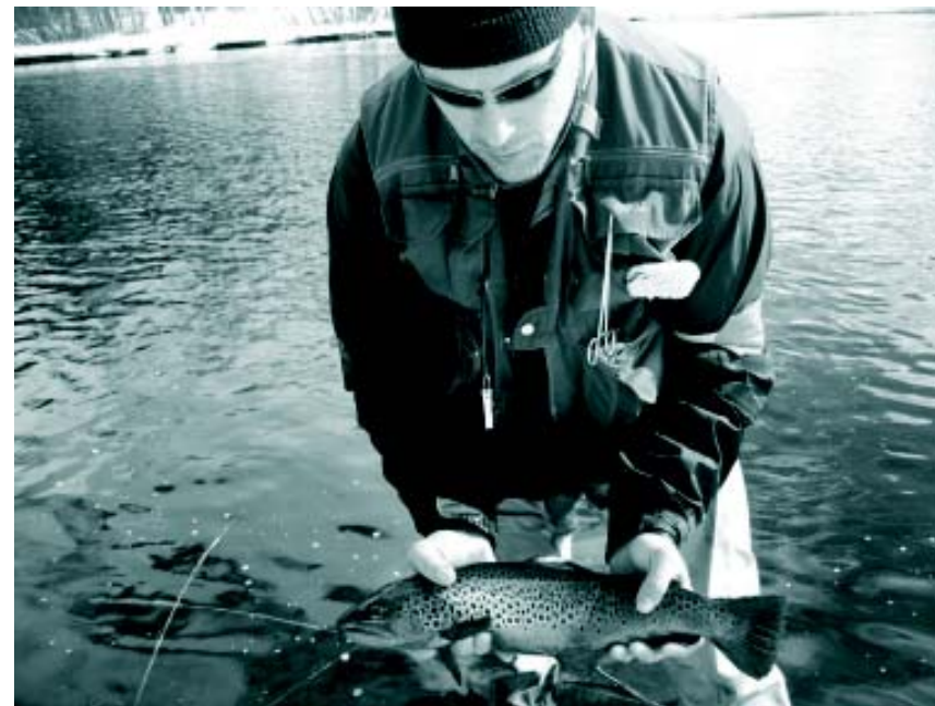
Huopanan sumaritaimenta Jaskan hartioiden leveydeltä.