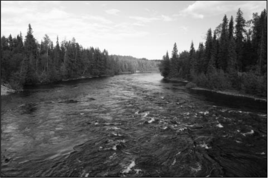
Ensimmäinen näkymä Olangajoelta.

suunnittelimme jo uutta reissua ensikesälle. Ajoneuvoksi pitää vaan pienen asuntoauton sijana ottaa Lada tai muu paikalliseen tiestöön paremmin soveltuva kulkupeli.