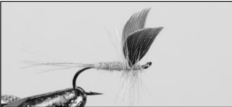
Kilpailun paras perho: Blue Dun (muunnos) Pisteitä 94, sitojana Timo Kontio.

Ohessa muutama poiminta SM-kisojen parhaista perhoista. Lisää kuvia perhoista, perhoreseptit ja tulokset löytyvät kisasivuilta osoitteesta www.perhosm.net