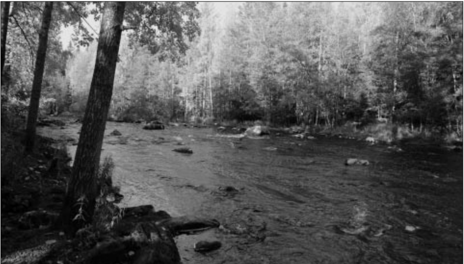
Syksyistä Lankoskea Merikarvianjoella.