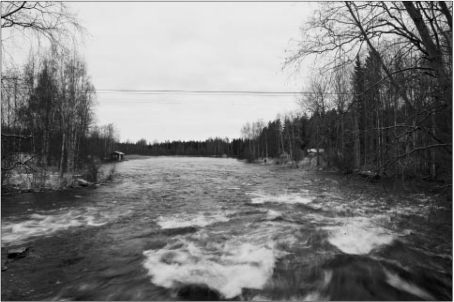
Riuttakoski Vanhalta sillalta.

Kalastuksellisesti reissu ei ollut kovin antoisa, ainakaan allekirjoittaneelle. Kalastusta haittasi ennen kaikkea erittäin korkealla ollut vesi, koski oli nimittäin jälleen kovassa tulvassa sateisen syksyn jäljiltä. Kyseisenä päivänä taisi olla itse asiassa vuoden tulvahuippu. Keli oli ihan hyvä, hieman nollan alapuolella, muttei liian kylmä, jotta se olisi haitannut erityisesti kalastusta.