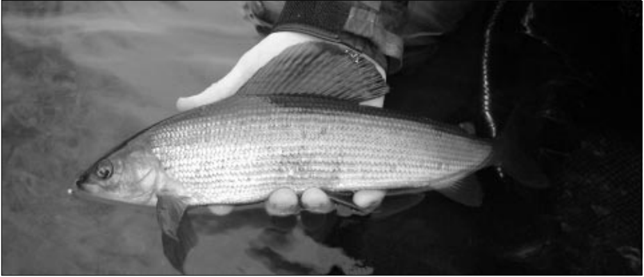
Jyrkin 35cm harjus. Kuva Jyrki Hiltunen.

suurimmat harjukset olivat noin 35-senttisiä. Ainoan mittataimenen sai Jouni ja ottipelinä oli valkoinen Drags Devil -streameri, taimen oli n. 45-senttinen.