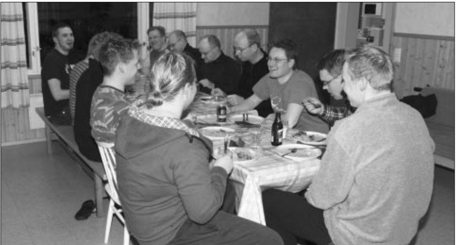
Pikkujouluporukka ruokailemassa.

Pikkujouluja jatkettiin illalla jouluruuan ja saunan jälkeen katselemalla porukalla kuvia kesän kalareissuilta, perhokalastusaiheisia DVD:tä sekä tietenkin kalajuttujen parissa. Pikkujouluissa oli jälleen kerran mukavaa, kiitos siitä kaikille mukana olleille!